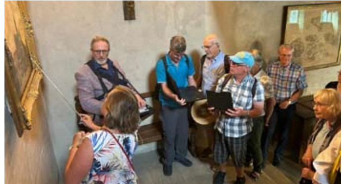
De velowalker in actie

De rondleidingen van Gilden worden overal in het land zeer gewaardeerd. Het is zeer wel denkbaar dat er aan de rondleidingen ook wordt deelgenomen door mensen met een gehoorbeperking. Dit kan variëren van licht slechthorend tot volledig doof. Meestal betreft dit oudere mensen die ofwel zichtbaar of vrijwel onzichtbaar een gehoorapparaat dragen en/of andere hoorhulpmiddelen gebruiken. Door slechthorenden voorafgaand te informeren over praktische hulpmiddelen en tijdens onze rondleidingen rekening te houden met hun specifieke behoeften worden hun mogelijkheden om deel te nemen aan onze rondleidingen vergroot. Bovendien wordt hiermee de inclusiviteit van het Gilde vergroot.