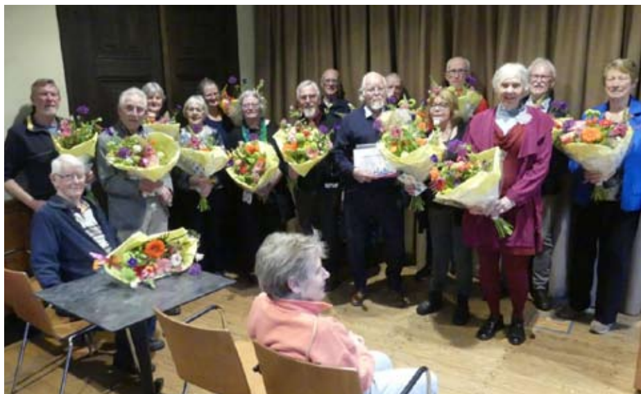
Tweeëntwintig jubilarissen van Gilde Nijmegen in de bloemetjes

Zo ook voor ons, vrijwilligers van Gilde Nijmegen. Na de ontvangst in de mooie overdekte binnenplaats en onder het genot van een bakje koffie of thee met appeltaart, was het al meteen lekker bijpraten. Tot de voorzitter de groep verzocht zich naar de raadszaal te begeven waar iedereen meteen onder de indruk was van de prachtige hoek met heel veel mooie gemengde boe-